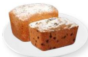
КЕКС - нежный, с творогом, 350 г - 109,99 - столичный, 330 г - 129,99