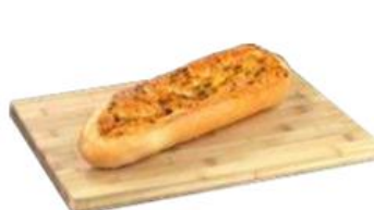
БАГЕТ ПРОВАНС, 230 г