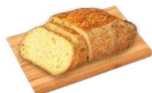
ХЛЕБ КУКУРУЗНЫЙ ОСОБЫЙ, 350 г