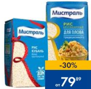
РИС МИСТРАЛЬ, 900 г, в ассортименте