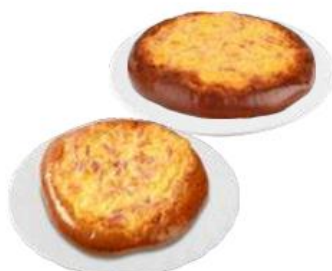
ЛЕПЕШКА СЫРНАЯ, с ветчиной - весовая - 37,49 - 180 г - 69,99