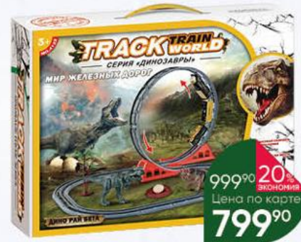
Игрушка TRACK Train World Динозавры Мир железных дорог

999 90 20% ЭКОНОМИЯ Цена по карте 799 90