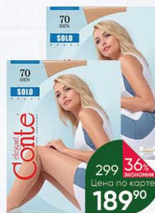
Колготки CONTE Elegant Solo женские 70 den nero, р. 2-4