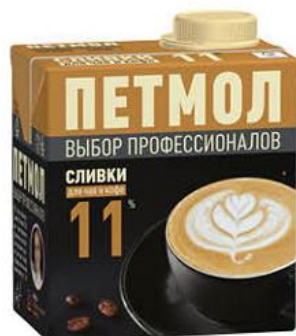
Сливки ПЕТМОЛ для чая и кофе ультрапастеризованные 11%, 0,5 л

189 90 32% ЭКОНОМИЯ Цена по карте 129 90