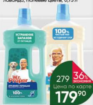
Моющая жидкость для полов и стен MR.PROPER для домов с питомцами; бережная уборка с содой, 1 л