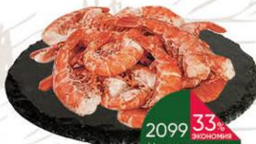
Креветки тигровые без головы, 1 кг