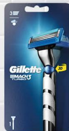
Бритва GILLETTE Mach 3 Turbo со сменными кассетами