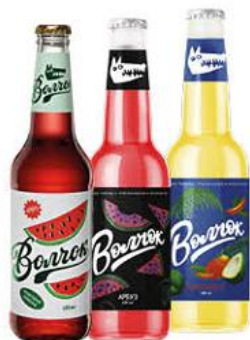
Напиток ВОЛКОВСКАЯ ПИВОВАРНЯ Волчок со вкусом арбуза; персика; манго и кокоса среднегазированный, 0,45 л