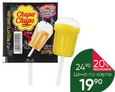
Карамель CHUPA CHUPS со вкусом тропических фруктов, 15 г