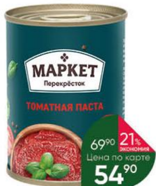
Паста томатная МАРКЕТ ПЕРЕКРЕСТОК, 140 г