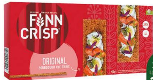
Сухарики FINN CRISP Original ржаные, 400 г