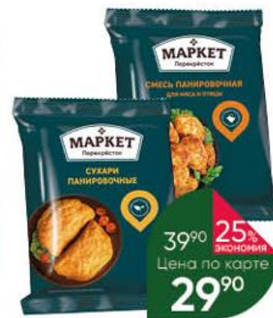
Сухари панировочные; Смесь панировочная MARKET ПЕРЕКРЕСТОК Классические; для мяса и птицы, 150 г