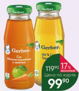
Сок GERBER грушевый; яблочно-морковный с мякотью, 175 мл