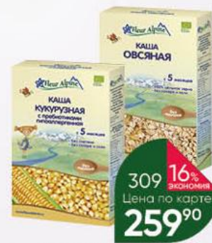
Каша FLEUR ALPINE с пребиотиками гипоаллергенная кукурузная; овсяная с 5 мес., 175 г