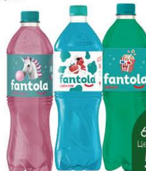
Напиток FANTOLA Bubble Gum; Space Cow; Popcorn сильногазированный, 1 л