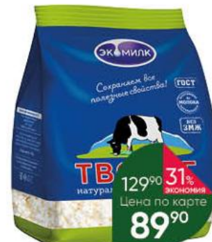
Творог ЭКОМИЛК натуральный рассыпчатый 5%, 350 г