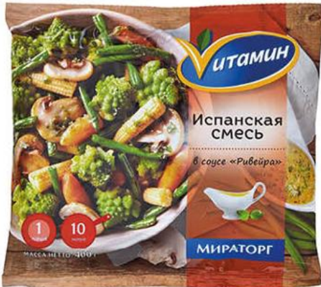
Смесь овощная МИРАТОРГ Итамин Испанская в соусе Ривейра, 400 г