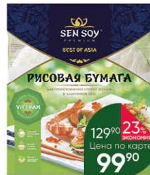
Бумага рисовая SEN SOY Premium для приготовления спринг роллов и блинчиков нем, 100 г