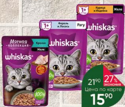
Корм для кошек WHISKAS консервы в ассортименте, 75 г

21% ЭКОНОМИЯ 27% ЭКОНОМИЯ Цена по карте 15 90