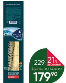
Скумбрия РУССКОЕ МОРЕ атлантическая холодного копчения, 300 г

149 90 20% ЭКОНОМИЯ Цена по карте 119 90