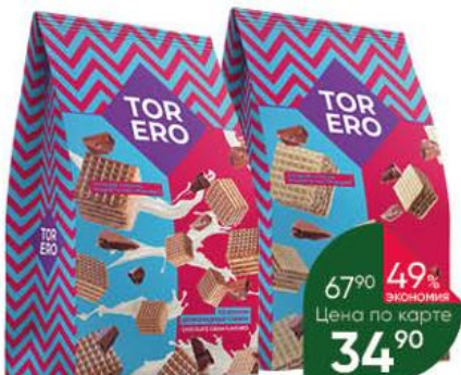
Вафли-мини TORERO со вкусом шоколадных сливок; шоколадные, 125 г