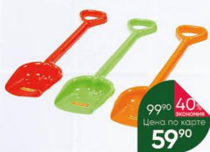
Игрушка Лопата большая