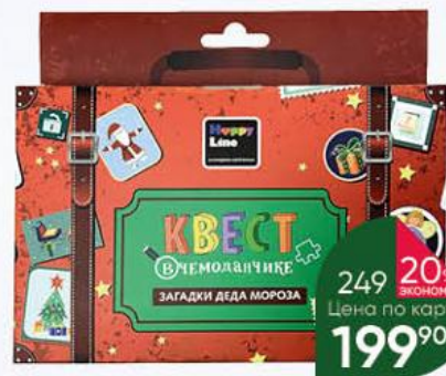
Игра настольная ДЕСЯТОЕ КОРОЛЕВСТВО Квест в чемоданчике Загадки Деда Мороза

179 90 22% ЭКОНОМИЯ Цена по карте 139 90