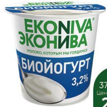
Биойогурт ЭКОНИВА 3,2%, 125 г