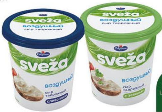
Сыр творожный САВУШКИН Sveža Воздушный с зеленью; сливочный 60%, 150 г