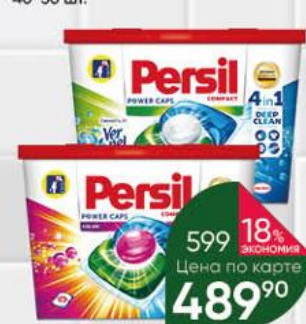
Средство для стирки PERSIL Power Caps Color; Свежесть от Verne! 4 в 1 капсулы, 21 шт.