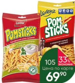
Чипсы LORENZ Pomsticks картофельная соломка в ассортименте, 100 г