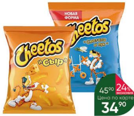
Палочки; Снеки SHEETOS кукурузные со вкусом сыра; сметана и лук, 50 г