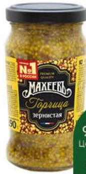
Горчица МАХЕЕВЪ зернистая, 190 г