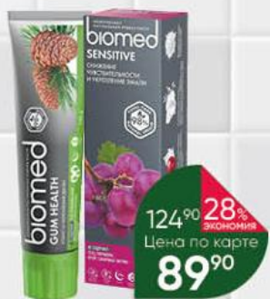
Зубная паста BIOMED Gum Health; Sensitive; White Complex, 100 г