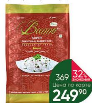
Рис BANNO Басмати Super Traditional, 1 кг