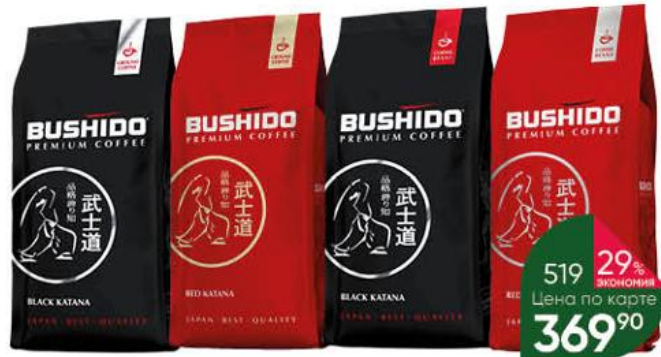
Кофе BUSHIDO Black; Red Katana натуральный жареный в зёрнах; молотый, 227 г