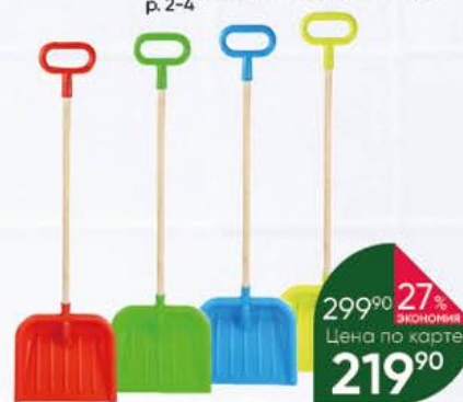
Лопата детская СТРОМ совковая с деревянной ручкой

299 90 27% ЭКОНОМИЯ Цена по карте 219 90