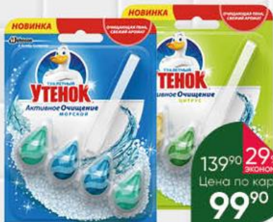
Средство чистящее для унитаза ТУАЛЕТНЫЙ УТЕНОК Активное очищение морской; цитрус, 38,6 г