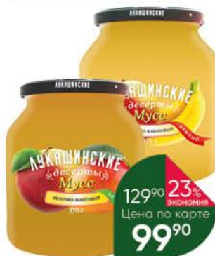
Мусс ЛУКАШИНСКИЕ Десерты Нежный; Фитнес; Экзотик, 370 г