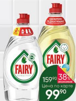
Средство для мытья посуды FAIRY в ассортименте, 430-450 мл