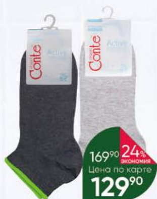
Носки CONTE Elegant Active женские, р. 23-24

169 90 24% ЭКОНОМИЯ Цена по карте 129 90