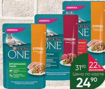
Корм для кошек PURINA One консервы курица с морковью; говядина с морковью; курица с зелёной фасолью, 75 г

18% ЭКОНОМИЯ 21% ЭКОНОМИЯ Цена по карте 14 90