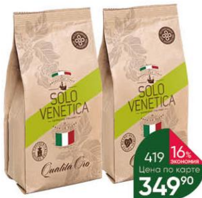
Кофе SOLO VENETICA Qualita Oro в зёрнах; молотый, 250 г