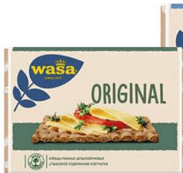
Хлебцы WASA Original ржаные цельнозерновые, 230-275 г