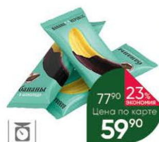
Конфеты ЭКО-ПРОДУКТ Banana Republic бананы в шоколаде, 100 г