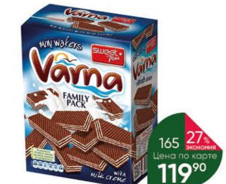
Вафли SWEET PLUS Varna mini с молочным кремом, 200 г

169 90 29% ЭКОНОМИЯ Цена по карте 119 90