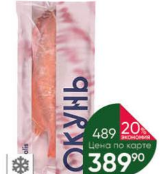
Окунь морской BOREALIS потрошённый без головы, 650 г