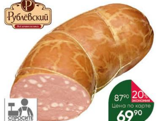
Колбаса РУБЛЁВСКИЙ Любительская варёная, 100 г