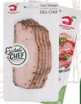
Пастрами МЯСНОЙ ДОМ БОРОДИНА Deli Chef из грудки индейки копчёно-варёная, 100 г

159 90 21% ЭКОНОМИЯ Цена по карте 126 90