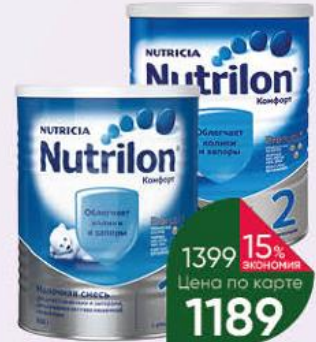
Смесь молочная NUTRICIA Nutrilon Комфорт 1 с рождения; 2 с 6 мес., 800-900 г