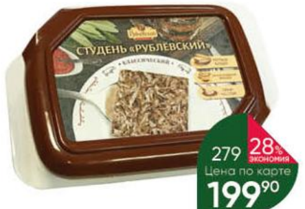
Студень РУБЛЁВСКИЙ Классический варёный охлаждённый, 380 г