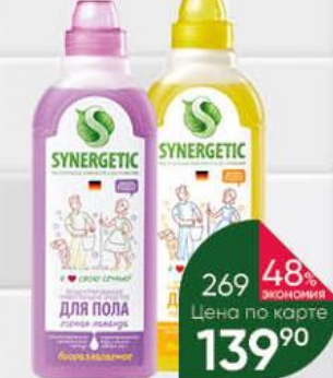
Средство биоразлагаемое SYNERGETIC для мытья поверхностей Горная лаванда; Полевые цветы, 0,75 л

199 90 40% ЭКОНОМИЯ Цена по карте 119 90