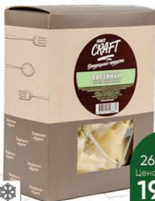
Вареники HANDY CRAFT с картофелем и луком, 600 г