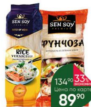
Макаронные изделия SEN SOY Premium фунчоза из зеленых бобов; вермишель Ну-Теу рисовая, 200 г