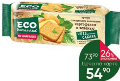
Крекеры ECO BOTANICA с картофелем и зеленью без сахара, 175 г