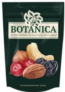
Смесь фруктово-ореховая BOTANICA , 140 г