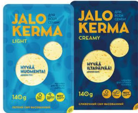
Сыр JALO KERMA Creamy; Light 30–50% 140 г

169 90 29% ЭКОНОМИЯ Цена по карте 119 90