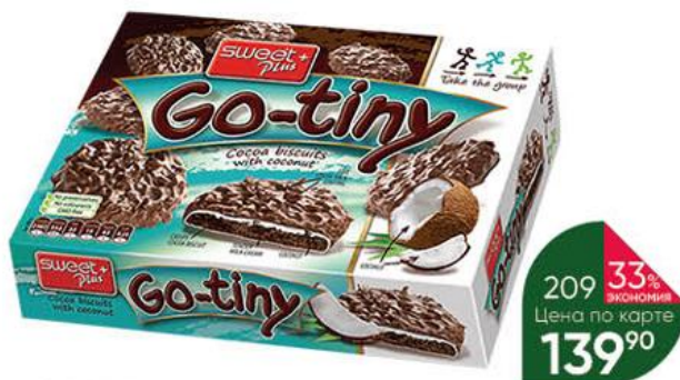
Печенье SWEET PLUS Go-Tiny шоколадное с кокосом, 130 г