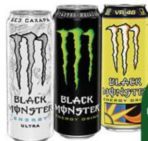
Напиток энергетический BLACK MONSTER в ассортименте сильногазированный, 0,449 л