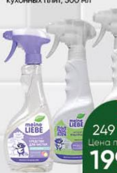
Средство чистящее MEINE LIEBE в ассортименте, 500 мл