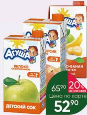
Сок АГУША в ассортименте, 500 мл