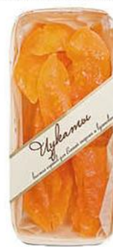
Цукаты АРКАДА дыня, 250 г