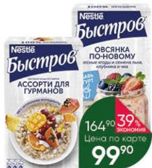
Каша NESTLE Быстров овсяная ассорти для гурманов; с киноа, манго и вишня; по-новому лесные ягоды, семена льна, клубника и чиа, 175-228 г