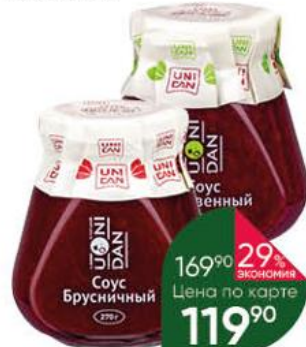
Соус UNI DAN брусничный; клюквенный для вторых блюд, 270 г