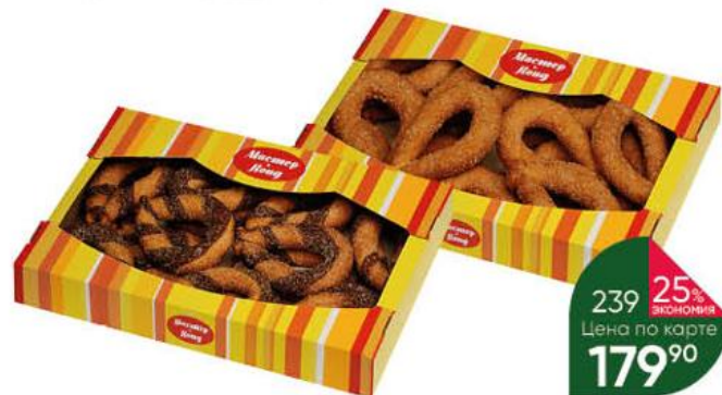
Изделие сдобное МАСТЕР-КОНД Княжий дар; какао, 300 г