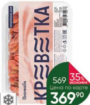
Креветка северная BOREALIS неразделанная варёно-мороженая 120+, 500 г