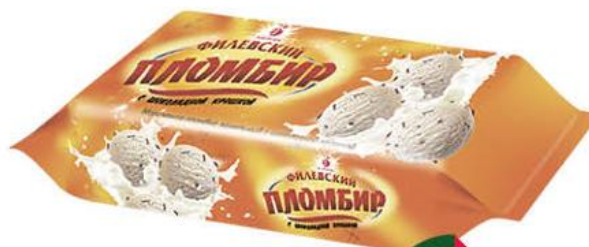
Мороженое АЙСБЕРРИ Филёвский пломбир ванильный с шоколадной крошкой 12%, 400 г