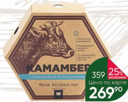
Сыр ИПАТОВ. МАСТЕРСКАЯ СЫРА Камамбер мягкий с благородной белой плесенью 50%, 125 г