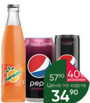
Напиток PEPSI; MIRINDA в ассортименте газированный, 0,33 л