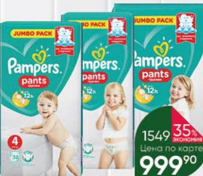
Трусики-подгузники PAMPERS Pants в ассортименте, 44-60 шт.