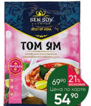
Основа для супа SEN SOY Том Ям, 80 г