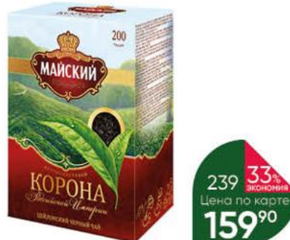
Чай МАЙСКИЙ Корона Российской Империи цейлонский чёрный листовой, 200 г