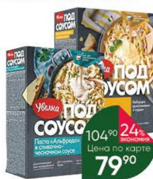
Набор для приготовления УВЕЛКА Под соусом паста Альфредо в сливочно-чесночном соусе; карбонара в сырном соусе, 290-340 г