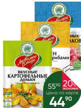
Приправа ВОЛШЕБНОЕ ДЕРЕВО в ассортименте, 22-140 г