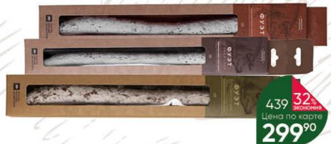
Колбаса ИПАТОВ МЯСНЫЕ ДЕЛИКАТЕСЫ Фуэт классическая; с трюфелем; с зелёным перцем сыровяленая полусухая с благородной белой плесенью, 150 г

179 90 17% ЭКОНОМИЯ Цена по карте 149 90