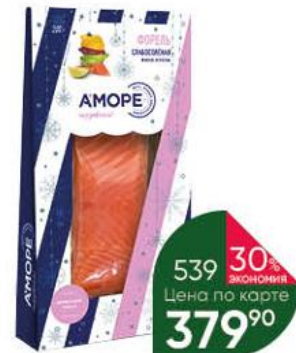
Форель АМОРЕ слабосоленая филе-кусоч, 200 г