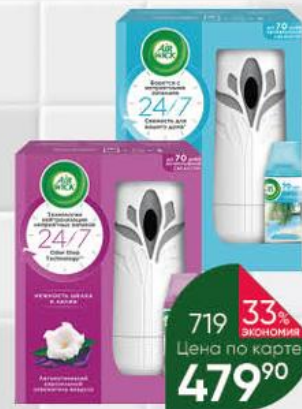
Освежитель воздуха AIR WICK автоматический со сменным баллоном голубая лагуна; цветущая вишня; нежность шёлка и лилии, 250 мл