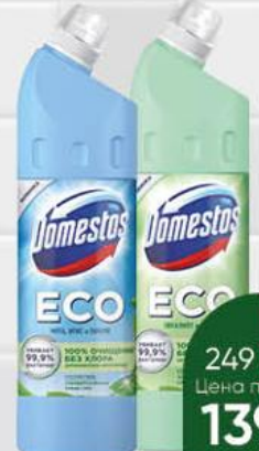
Средство чистящее DOMESTOS Есо мята, ирис и пачули; эвкалипт и лимон, 750 мл