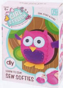
Набор для детского творчества Набор для шитья

179 90 22% ЭКОНОМИЯ Цена по карте 139 90