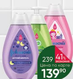
Шампунь; Гель JOHNSON'S в ассортименте, 300 мл