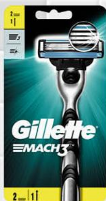
Станок для бритья GILLETTE Mach 3 с 2 кассетами