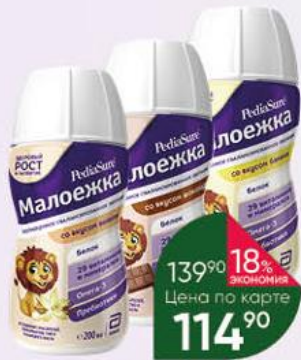
Смесь PEDIASURE Малоежка жидкая в ассортименте, 200 мл