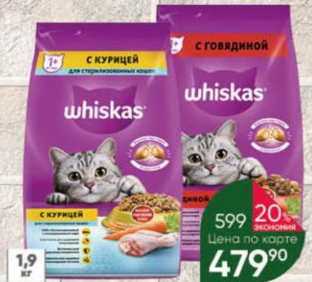
Корм для кошек WHISKAS Вкусные подушечки с нежным паштетом аппетитный обед с говядиной; курицей, 1,9 кг