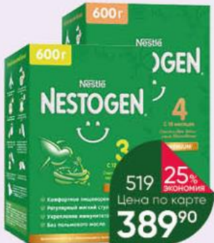
Напиток NESTLE Nestogen Premium 3 с 12 мес.; 4 молочный с пребиотиками с 18 мес., 600 г