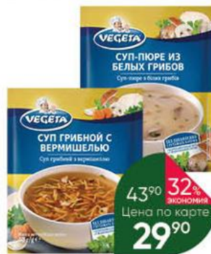
Суп-пюре VEGETA грибной с вермишелью; из белых грибов, 40-48 г