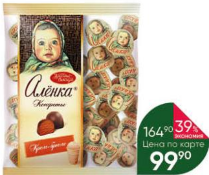
Конфеты КРАСНЫЙ ОКТЯБРЬ Алёнка крем-бриоль, 250 г