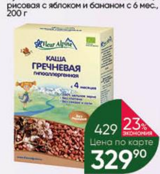
Каша FLEUR ALPINE гречневая безмолочная гипоаллергенная с 4 мес., 175 г