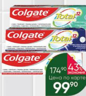
Зубная паста COLGATE Total 12 в ассортименте, 75 мл