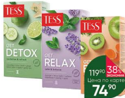
Чайный напиток TESS в ассортименте, 20 x 1,5 г