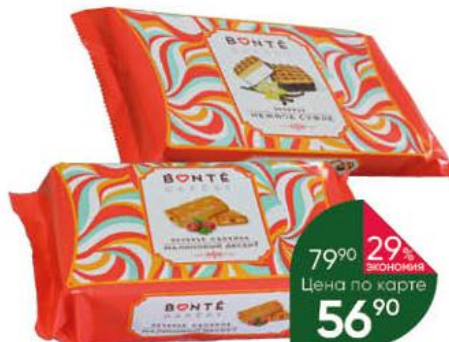
Печенье BONTÉ Вакегу Сдобное малиновый десерт; нежное суфле, 240-270 г