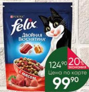
Корм для кошек PURINA Felix Двойная вкуснятина с мясом, 300 г

51% ЭКОНОМИЯ 23% ЭКОНОМИЯ Цена по карте 39 90