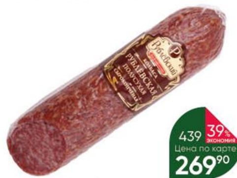
Колбаса РУБЛЕВСКИЙ Рублевская сырокопченая полусухая, 270 г

219 90 32% экономия Цена по карте 149 90