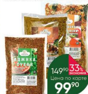
Приправа СПЕЦ и Я МОРОЗОВА По-кубански с вялеными и сушеными овощами; Аджика сухая; Сванская, 150 г