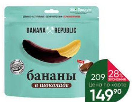
Конфеты ЭКО-ПРОДУКТ Banana Republic бананы в шоколаде, 180 г

199 90 35% ЭКОНОМИЯ Цена по карте 129 90