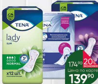
Урологические прокладки TENA в ассортименте, 6-12 шт.

174 90 20% ЭКОНОМИЯ Цена по карте 139 90