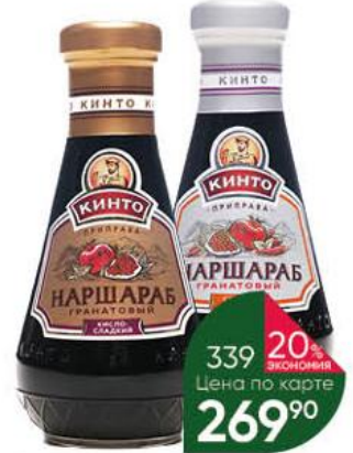
Соус KINTO Наршараб гранатовый сладко-острый; кисло-сладкий, 380 г