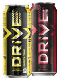
Напиток энергетический DRIVE ME кофеин-витамины; кофеин-таурин-витамины газированный, 0,449 л