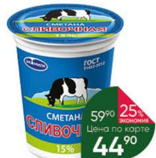
Сметана ЭКОМИЛК Сливочная 15%, 315 г