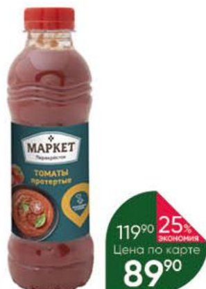
Томаты МАРКЕТ ПЕРЕКРЕСТОК протёртые, 540 г