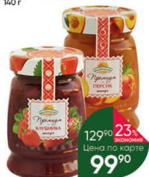
Десерт ЭКОПРОДУКТ Премия клубника; персик, 330 г