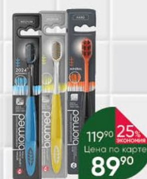
Зубная щётка BIOMED Black; Silver; Mineral, 1 шт.