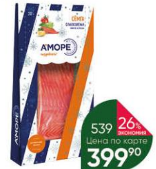
Сёмга АМОРЕ слабосоленая филе-кусоч, 200 г