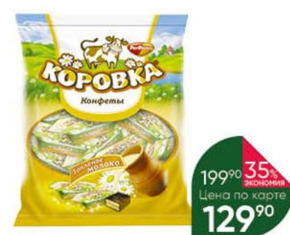
Конфеты РОТ ФРОНТ Коровка топленое молоко, 250 г

174 90 26% ЭКОНОМИЯ Цена по карте 129 90