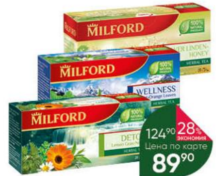
Чай MILFORD травяной в ассортименте, 20 x 2-2,25 г