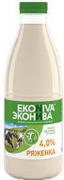
Ряженка ЭКОНИВА 4%, 1 кг