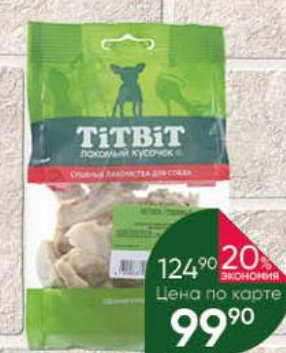
Лакомство для собак TITBIT Лакомый кусочек лёгкое говяжье, 18 г

93% ЭКОНОМИЯ 20% ЭКОНОМИЯ Цена по карте 74 90