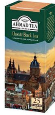
Чай AHMAD TEA Классический чёрный, 25 x 2 г