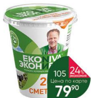
Сметана ЭКОНИВА 20%, 300 г