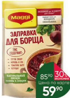
Заправка MAGGI для борща, 250 г