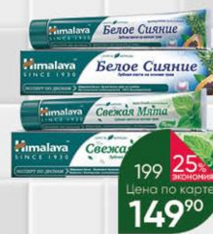
Зубная паста HIMALAYA Свежая мята; Белое сияние, 75 мл

164 90 21% ЭКОНОМИЯ Цена по карте 129 90