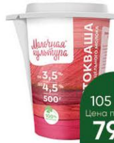
Простокваша МОЛОЧНАЯ КУЛЬТУРА 3,5-4,5%, 500 г