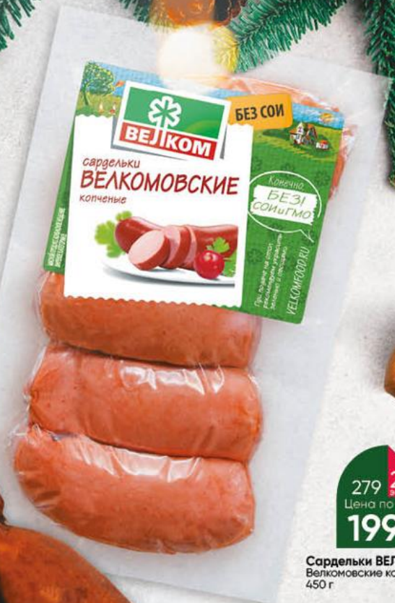
Сардельки ВЕЛКОМ Велкомовские копченые, 450 г