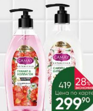
Гель для душа SAMAY Botanicals Сакура и витамин В3; Гранат и коллаген, 750 мл