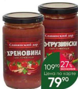
Соус томатный СЛАВЯНСКИЙ ДАР Хреновина; По-грузински; Шашлык- машлык, 360 г