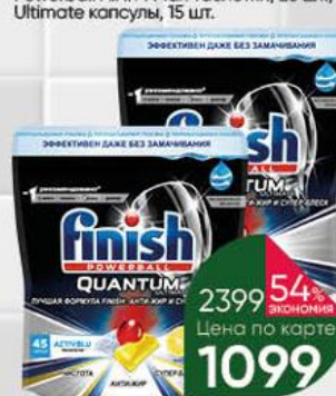
Капсулы для мытья посуды в посудомоечной машине FINISH Quantum Ultimate лимон; без ароматизатора, 45 шт.