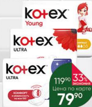
Гигиенические прокладки KOTEX в ассортименте, 6-10 шт.