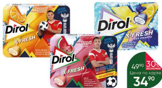
Жевательная резинка DIROL X-Fresh Арбузный лёд; Ледяной мандарин; Свежесть черники и цитруса, 16 г