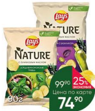
Чипсы LAY'S Nature из натурального картофеля со вкусом сыра фета с базиликом; средиземноморских трав, 90 г