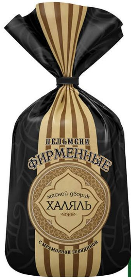
Пельмени МЯСНОЙ ДВОРИК Халяль Фирменные, 800 г