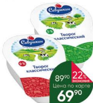
Творог САБУШКИН Классический 1%; 5%; 9%, 200 г