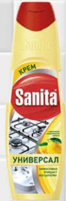
Крем чистящий SANITA Универсал Сила лимона, 600 г