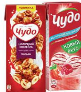
Коктейль молочный ЧУДО в ассортименте 2-3%, 200 мл