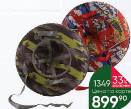
Санки Ватрушка надувная, 90 см, 1 шт.