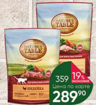
Корм для кошек NATURE'S TABLE курица; индейка, 650 г