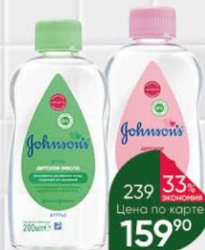
Детское масло JOHNSON'S с алоэ; без добавок, 200 мл