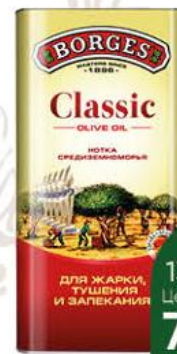
Масло оливковое BORGES Classic Хотка средиземноморья, 1 л

Товар представлен не во всех супермаркетах «Перекрёсток».