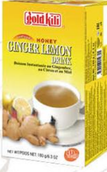
Напиток GOLD KILI с имбирём, мёдом и лимоном, 180 г