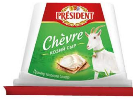
Сыр козий PRESIDENT Chèvre 65%, 140 г