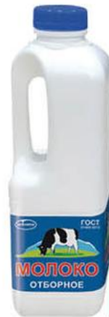
Молоко ЭКОМИЛК Отборное 3,4-4,5%, 900 мл