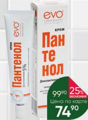
Крем EVO LABORATORIES Пантенол, 46 мл