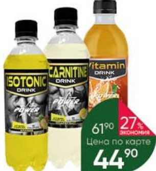
Напиток POWER Vitamin drink; Isotonic drink; L-carnitine drink в ассортименте, 0,5 л