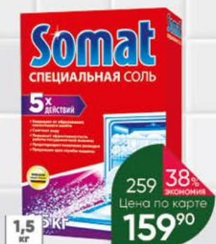
Соль для посудомоечных машин SOMAT, 1,5 кг