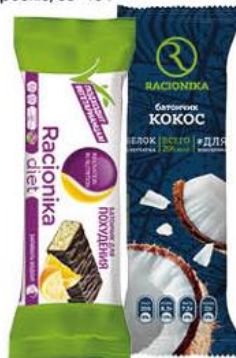
Батончик RACIONIKA для похудения со вкусом апельсина; кокоса, 50-60 г