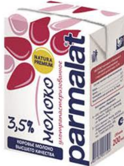
Молоко PARMALAT Natura Premium ультрапастеризованное 3,5%, 200 мл