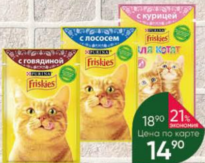
Корм для кошек PURINA Friskies с говядиной; лососем; курицей, 85 г

18% ЭКОНОМИЯ 21% ЭКОНОМИЯ Цена по карте 14 90