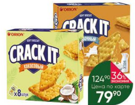
Печенье затяжное ORION Crack It кокосовый; сливочный, 144-160 г