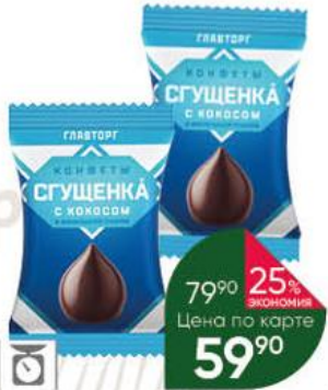
Конфеты ГЛАВТОРГ сгущенка с кокосом в шоколадной глазури, 100 г