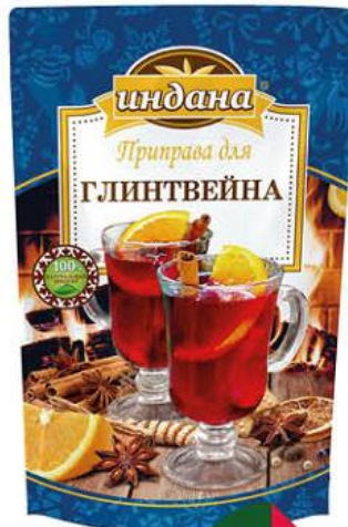
Приправа для глинтвейна ИНДАНА, 40 г