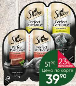
Корм для кошек SHEBA Perfect Portions паштет с говядиной; курицей, 2 x 37,5 г

51% ЭКОНОМИЯ 23% ЭКОНОМИЯ Цена по карте 39 90