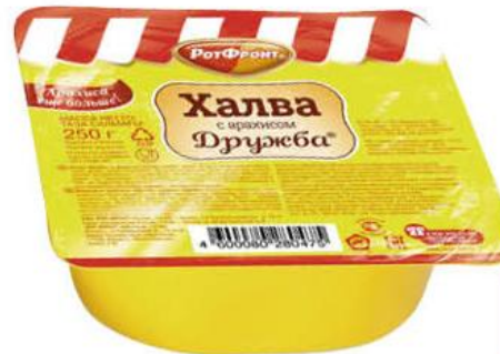
Халва РОТ ФРОНТ Дружба подсолнечная арахисом, 250 г