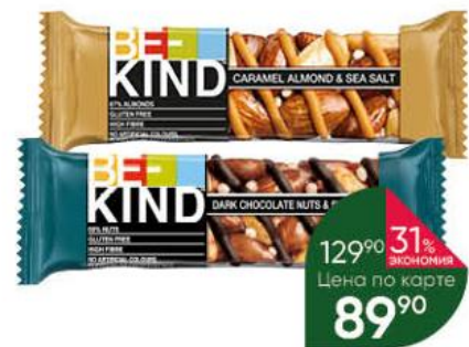
Ореховый батончик BE-KIND с тёмным шоколадом и морской солью; мёдом, морской солью и вкусом карамели, 30 г