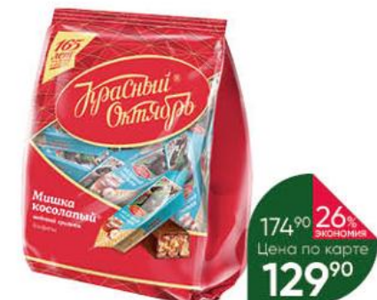
Конфеты КРАСНЫЙ ОКТЯБРЬ Мишка косопалый медовый грильяж, 200 г

174 90 26% ЭКОНОМИЯ Цена по карте 129 90