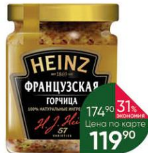
Горчица HEINZ Французская, 180 г