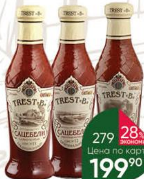
Соус ТРЕСТЬ Trest «B» Сацебели Традиционный слабо-острый № 11; Оригинальный умеренно-острый № 12; Чертовка острый № 13, 260 г