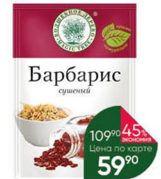
Барбарис ВОЛШЕБНОЕ ДЕРЕВО сушёный, 10 г