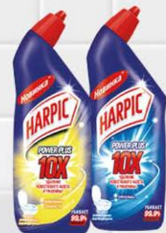
Средство дезинфицирующее для унитаза HARPIC Power Plus Original; Лимонная свежесть, 700 мл

189 90 32% ЭКОНОМИЯ Цена по карте 129 90