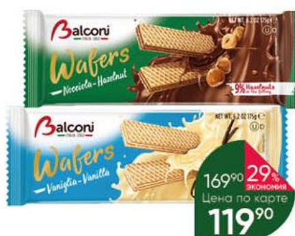
Вафли BALCONI Wafers с ванильной; ореховой начинкой, 175 г

169 90 29% ЭКОНОМИЯ Цена по карте 119 90