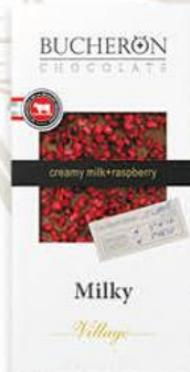
Шоколад BUCHERON Village молочный с кусочками малины 33%, 100 г

189 90 21% ЭКОНОМИЯ Цена по карте 149 90