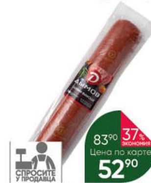
Колбаса ДЫМОВ Салами Финская полукопчёная, 100 г