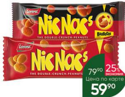
Арахис LORENZ Nis Nacs в хрустящей оболочке с приправой; барбекю, 35-40 г