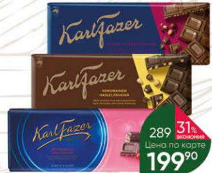
Шоколад KARL FAZER в ассортименте, 200 г