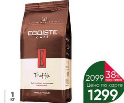
Кофе EGOISTE Truffle натуральный жареный в зёрнах, 1 кг

Товар представлен не во всех супермаркетах «Перекрёсток».