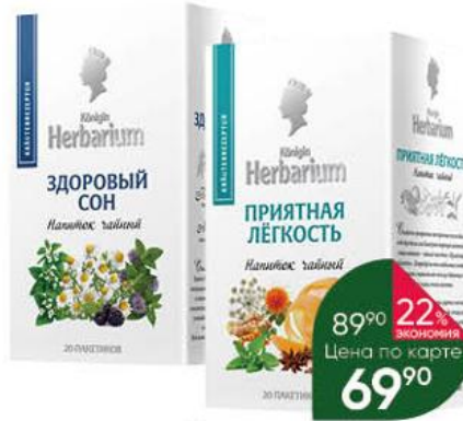
Чайный напиток KÖNIGIN HERBARIUM Здоровый сон; Приятная лёгкость; Тёплый шарф, 20 x 1,5 г