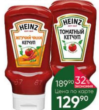
Кетчуп HEINZ Жгучий чили; с чесноком; томатный, 460 г