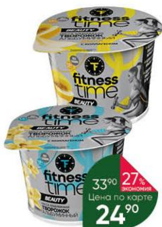
Творожок альбуминный FITNESS TIME Beauty со вкусом ванили; дыни с коллагеном 1,5%, 100 г