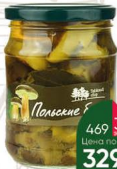
Грибы ТАЁЖНЫЙ СБОР Польские белые маринованные, 500 г