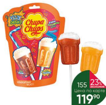
Карамель CHUPA CHUPS Fizzy Drinks со вкусом колы и апельсина, 105 г