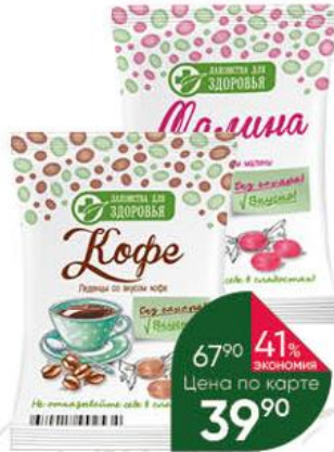
Леденцы ЛАКОМСТВА ДЛЯ ЗДОРОВЬЯ вкус кофе; малины, 50 г