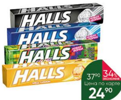
Леденцы HALLS в ассортименте, 24,5-25 г