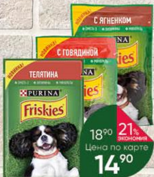
Корм для собак PURINA Friskies консервы с говядиной; ягнёнком; телятиной, 85 г

18% ЭКОНОМИЯ 21% ЭКОНОМИЯ Цена по карте 14 90