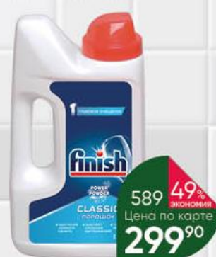
Средство для мытья посуды в посудомоечной машине FINISH Power Powder порошок, 1 кг