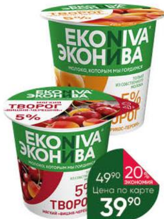
Продукт творожный ЭКОНИВА вишня-черешня; абрикос-персик 5%, 125 г