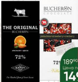
Шоколад BUCHERON The Original апельсин+орехи; Village клюква+клубника+фисташки горький 72%, 100 г

189 90 21% ЭКОНОМИЯ Цена по карте 149 90