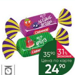
Конфеты САВИНОВ жевательные со вкусом лесных ягод; арбуза, 100 г