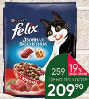
Корм для кошек PURINA Felix Двойная вкуснятина с мясом, 750 г