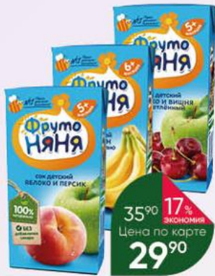
Нектар; Сок; Напиток ФРУТОНЯНЯ в ассортименте с 4; 5; 6 мес., 200 мл