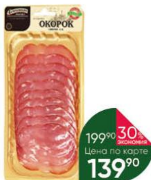
Окорок ЕГОР'ЕВСКАЯ По-егорьевски сырокопченый, 115 г

169 90 29% экономия Цена по карте 119 90