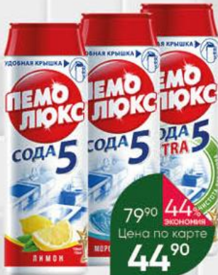
Чистящий порошок ПЕМОЛЮКС Сода 5; Сода Extra 5 в ассортименте, 480 г