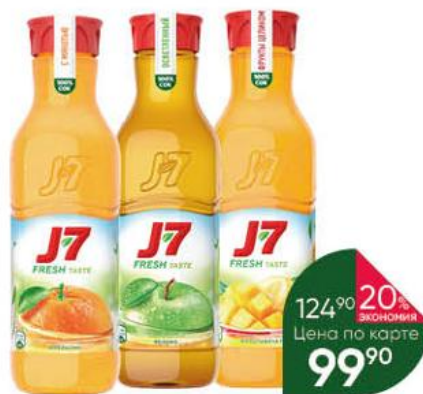
Сок J7 Fresh Taste в ассортименте, 0,85 л