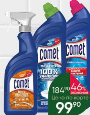
Средство чистящее COMET в ассортименте, 450-700 мл