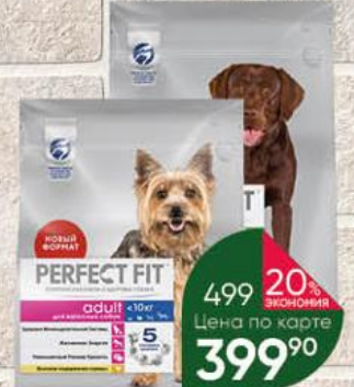
Корм PERFECT FIT с курицей для взрослых мелких и миниатюрных пород старше 1 года; средних и крупных пород, 1,2-1,4 кг