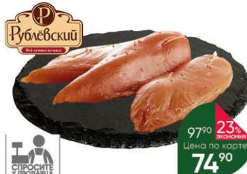
Карпаччо РУБЛЁВСКИЙ из мяса птицы сырокопчёное, 100 г