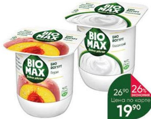
Биойогурт BIO MAX Двойное действие с персиком; Классический 2,2-2,7%, 125 г