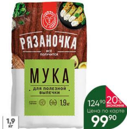
Мука РЯЗАНОЧКА пшеничная для полезной выпечки, 1,9 кг