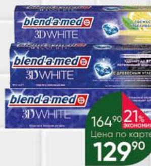
Зубная паста BLEND-A-MED 3D White Бережная мята; с экстрактом древесного угля; свежий лимон, 100 г

164 90 21% ЭКОНОМИЯ Цена по карте 129 90