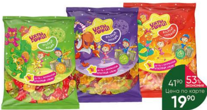
Мармелад УХТЫШКИ! Весёлые мишки; Весёлые червячки; Весёлый зоопарк жевательный фигурный, 70 г