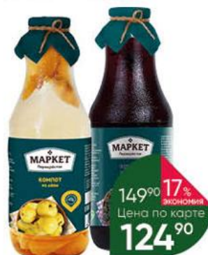
Компот МАРКЕТ ПЕРЕКРЕСТОК в ассортименте, 1000-1050 г