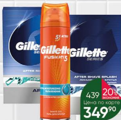
Средство для бритья GILLETTE гель; лосьон в ассортименте, 100–200 мл