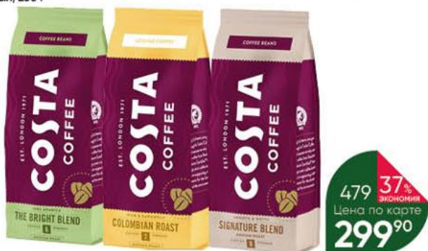
Кофе COSTA The Bright Blend; Colombian Roast; Signature Blend в зёрнах; молотый, 200 г