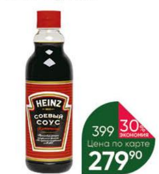
Соус HEINZ соевый Классический, 635 мл