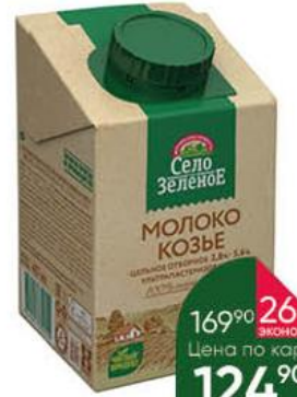
Молоко СЕЛО ЗЕЛЁНОЕ козье цельное 2,8-5,6%, 487 мл