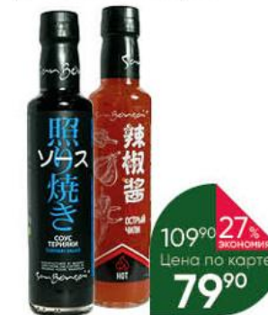
Соус SANBONSAI терияки; острый чили, 300 г