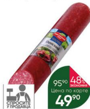
Сервелат МЯСНИЦКИЙ РЯД Венский из мяса птицы варёно-копчёный, 100 г

144 90 24% экономия Цена по карте 109 90