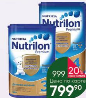
Напиток NUTRICIA Nutrilon Детское молочко Premium 3 с 12 мес.; Premium 4 молочный с 18 мес., 800 г