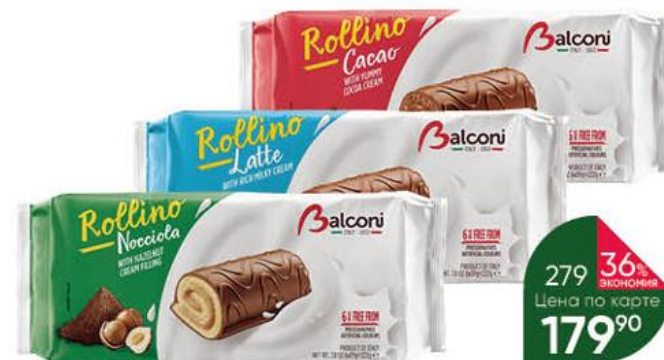
Рулеты BALCONI Rollino Latte с молочной; Nocciole ореховой; Cacao какао-начинкой покрытые какао-глазурью бисквитные, 6 x 37 г