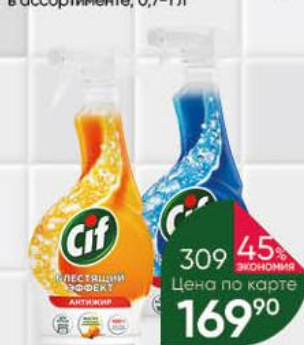
Средство чистящее CIF Блестящий эффект антижир Сила природы для сантехники; Power&Shine для ванной; для кухни, 500 мл