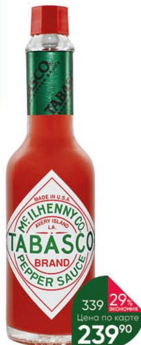
Соус MC.ILHENNY CO. Tabasco Pepper красный перечный, 60 мл