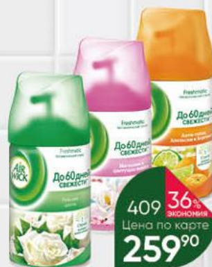
Сменный баллон AIR WICK в ассортименте, 250 мл