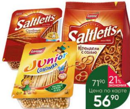
Крендели; Палочки; Соломка LORENZ Saltletts с солью классические; Junior, 130-150 г