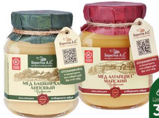
Мёд БЕРЕСТОВ А.С. натуральный Башкирхан липовый; Алтайцвет майский, 500 г

259 90 23% ЭКОНОМИЯ Цена по карте 199 90