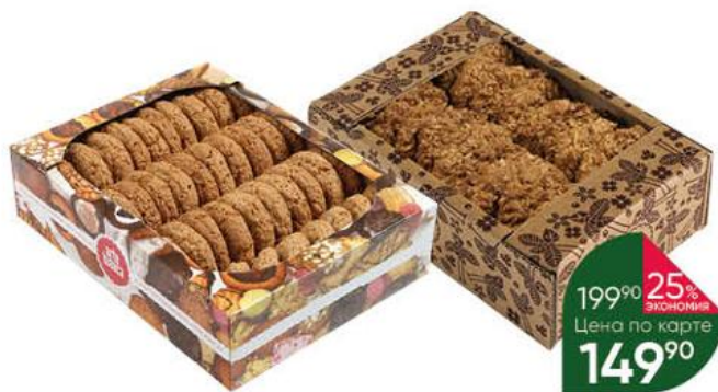
Изделие хлебобулочное ARTE BIANCA Алтайское солнышко; Душа Алтая с овсяными хлопьями, 400-450 г