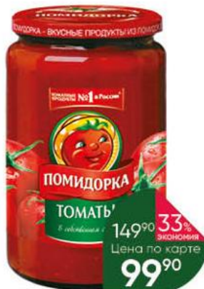
Томаты ПОМИДОРКА в собственном соку, 680 г