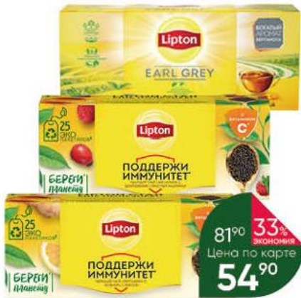
Чай LIPTON Yellow Label; Earl Grey; Поддержи иммунитет с лимоном и имбирём; Поддержи иммунитет с шиповником и ароматом земляники, 25 x 1,5-2 г