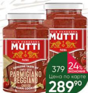
Соус томатный MUTTI Ратта с базиликом; с сыром Пармиджано Реджано; с овощами гриль, 400 г