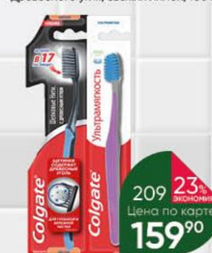
Зубная щётка COLGATE Ультратонкость; Шёлковые нити с древесным углём, 1 шт.