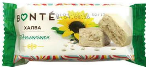
Халва BONTÉ подсолнечная, 250 г

619 90 35% ЭКОНОМИЯ Цена по карте 399 90