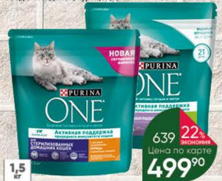
Корм для кошек PURINA One сухой в ассортименте, 1,5 кг

31% ЭКОНОМИЯ 22% ЭКОНОМИЯ Цена по карте 24 90