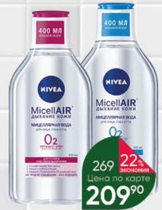
Мицеллярная вода NIVEA Дыхание кожи Смягчающая 3 в 1 для нормальной и комбинированной кожи; для сухой и чувствительной кожи, 400 мл