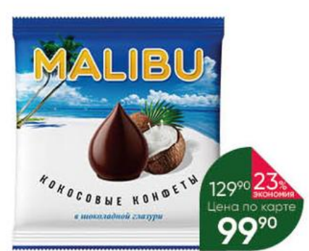
Конфеты MALIBU кокосовые в шоколадной глазури, 140 г