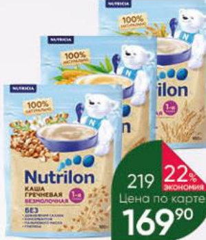
Каша NUTRICIA Nutrilon 1-я ложка безмолочная кукурузная; гречневая; рисовая, 180 г