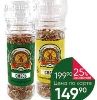
Смесь СТАНДАРТ КАЧЕСТВА Итальянская; чесночная сванская, 60-72 г