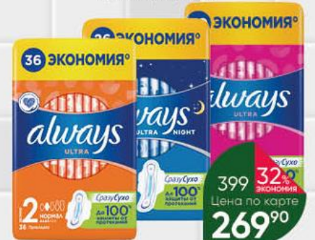
Гигиенические прокладки ALWAYS Ultra Night; Normal; Super Quatro, 26-36 шт.

174 90 20% ЭКОНОМИЯ Цена по карте 139 90