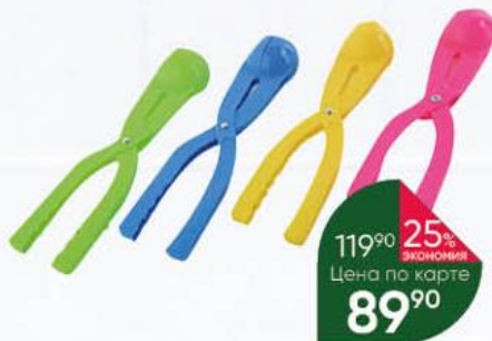
Снежки YBS-004, 1 шт.