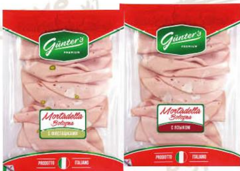
Колбаса GÜNTER'S Premium Mortadella Bologna с фисташками; с языком варёная, 120 г

179 90 17% ЭКОНОМИЯ Цена по карте 149 90