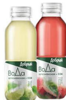
Напиток сокодержатель ДОБРЫЙ Сочный лимон и мята; Нежная клубника и базилик, 0,45 л