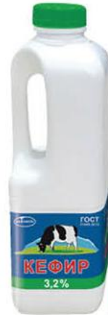
Кефир ЭКОМИЛК 3,2%, 900 мл