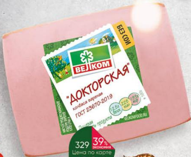
Колбаса ВЕЛКОМ Докторская вареная, 500 г