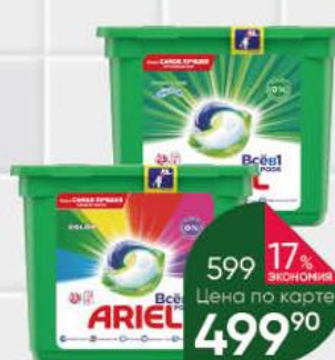
Средство для стирки ARIEL Всё в 1 Pods Color & Style; Горный родник капсулы, 23 шт.

Товар представлен не во всех супермаркетах «Перекрёсток».