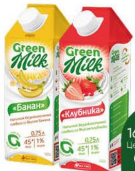
Напиток GREEN MILK соевый со вкусом банана; клубники, 0,75 л