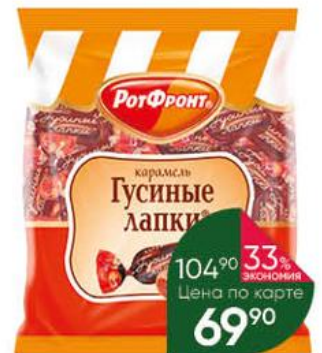
Карамель РОТ ФРОНТ Гусиные лапки, 250 г