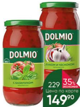
Соус DOLMIO в ассортименте, 500 г

Апельсин вместе с кожурой порежьте кубиками. Яблоки очистите от сердцевины и также порежьте кубиками. Откройте упаковку вишнёвого сока, вылейте сок в кастрюлю. Положите к соку нарезанные яблоки и апельсин. Добавьте приправу для глинтвейна и сахар, слегка размешайте. Поставьте кастрюлю с соком, фруктами и пряностями на средний огонь. Нагревайте, наблюдая за смесью, пока на поверхности не появятся первые признаки кипения. Сразу снимите кастрюлю с огня и с помощью половника разлейте глинтвейн по бокалам.