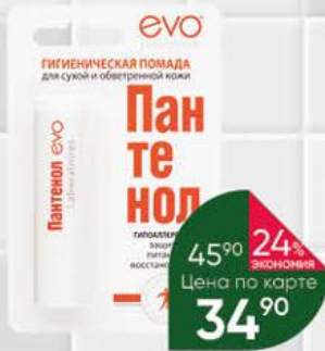
Гигиеническая помада EVO LABORATORIES Пантенол, 2,8 г