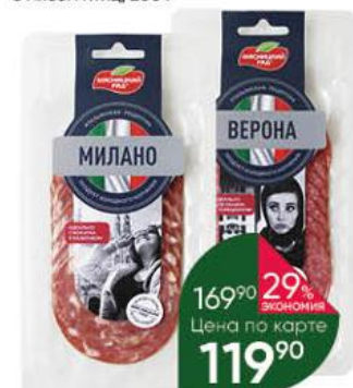
Колбаса МЯСНИЦКИЙ РЯД Верона; Милано сыровяленая полусухая, 90 г

184 90 35% экономия Цена по карте 119 90