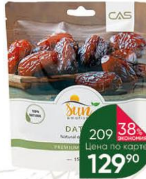
Финики сушёные SUN EMOTIONS без косточки, 150 г