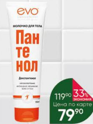
Молочко для тела EVO LABORATORIES Пантенол, 150 мл