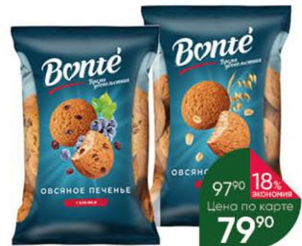
Печенье BONTÉ овсяное Классическое; с изюмом, 400 г