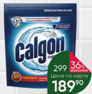
Порошок CALGON для смягчения воды и предотвращения образования известкового налёта 3 в 1, 400 г