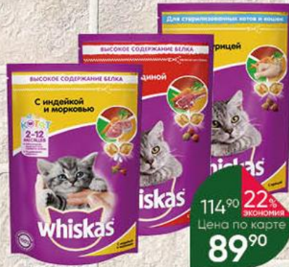
Корм для кошек WHISKAS Вкусные подушечки в ассортименте, 350 г

21% ЭКОНОМИЯ 27% ЭКОНОМИЯ Цена по карте 15 90