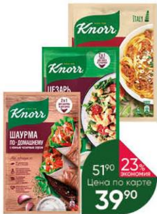
Приправа KNORR в ассортименте, 25-32 г