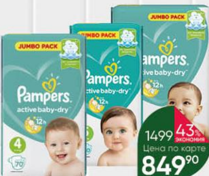
Подгузники PAMPERS Active Baby р. 3, 4-9 кг, 82 шт.; р. 4, 8-14 кг, 70 шт.; р. 5, 11-16 кг, 60 шт.