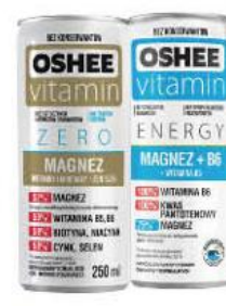
Напиток OSHEE Vitamin energy formula magnesium со вкусом фруктов; ягод аcai газированный безалкогольный, 250 мл