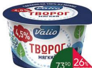
Творог VALIO мягкий 4,5%, 180 г