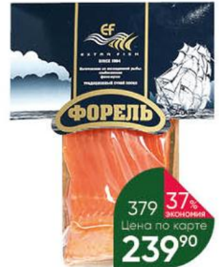
Форель EXTRA FISH родужная филе с кожей, 200 г