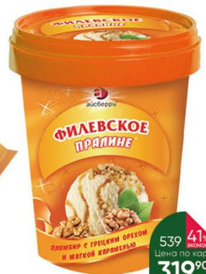
Мороженое АЙСБЕРРИ Филёвское пралине пломбир с грецким орехом и мягкой карамелью 12%, 550 г