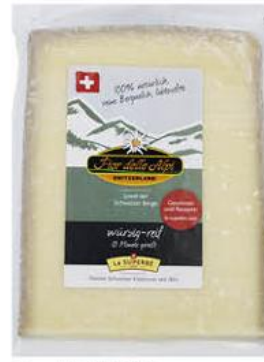
Сыр LE SUPERBE Fior delle Alpi 50%, 200 г