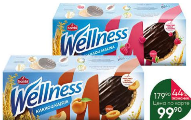
Печенье BAMBÌ Wellness какао-малина; какао-абрикос, 150 г