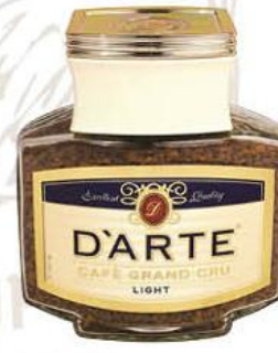
Кофе D'ARTE Light с пониженным содержанием кофеина, 100 г