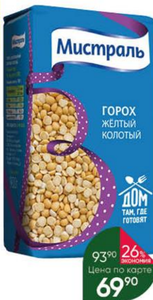
Горох МИСТРАЛЬ жёлтый колотый, 900 г