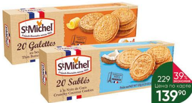
Печенье ST MICHEL кокосовое; сливочное традиционное, 120-130 г