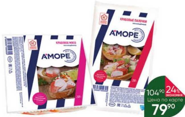
Крабовые палочки; Крабовое мясо АМОРЕ имитация, 200 г