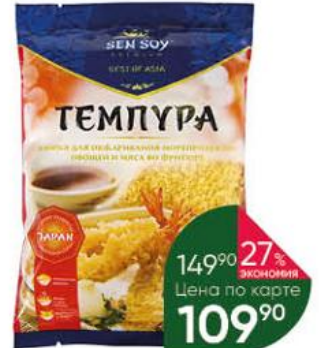
Японские панировочные хлопья SEN SOY Premium Темпура, 100 г

149 90 27% ЭКОНОМИЯ Цена по карте 109 90