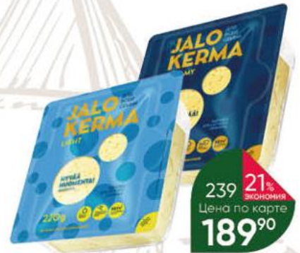
Сыр JALO KERMA Light; Creamy 30-50%, 220 г