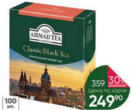
Чай AHMAD TEA Классический чёрный, 100 x 2 г