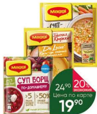
Суп MAGGI в ассортименте, 19-54 г

Горох замочите на 4-5 часов. Морковь натрите на тёрке, а картофель порежьте кубиками. Репчатый лук мелко нарежьте. Сложите курицу и рёбрышки в кастрюлю, налейте 2,5 л воды и поставьте на огонь. Доведите до кипения, снимите пену, добавьте лавровый лист и соль. Положите горох и варите 1 час. Достаньте из бульона курицу и рёбрышки, отделите мясо от костей, нарежьте небольшими кусочками. Положите в суп картофель и варите ещё 15 минут. Затем положите в суп морковь и лук, верните нарезанное мясо и варите ещё 10 минут.