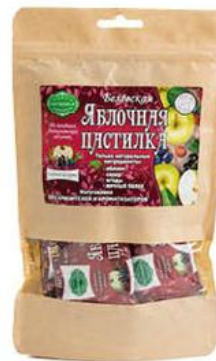
Пастилка БЕЛЁВСКАЯ яблочная, 175 г

279 90 39% ЭКОНОМИЯ Цена по карте 169 90