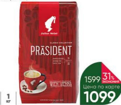
Кофе JULIUS MEINL President Classic Collection в зёрнах, 1 кг