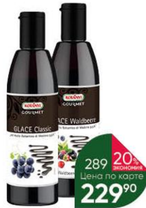
Крем-соус бальзамический KOTANYI Gourmet Glace Waldbeere со вкусом лесных ягод; Classic, 250 мл