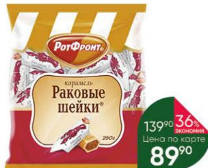
Карамель РОТ ФРОНТ Раковые шейки, 250 г