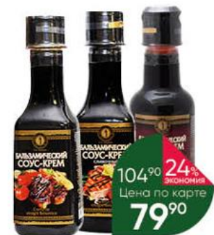
Соус-крем СП МИРНЫЙ балзамический со вкусом граната; сливочный; классический, 220 мл