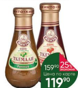
Соус фруктовый КИНТО Ткемали классический кисло- сладкий; ранний пряный, 300 г