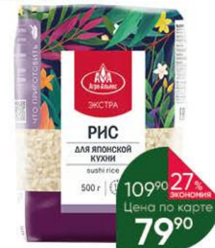
Рис АГРО-АЛЬЯНС для японской кухни, 500 г