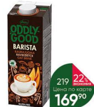
Овсяный напиток VALIO Oddly Good Barista без глютена, 1 л

179 90 33% ЭКОНОМИЯ Цена по карте 119 90