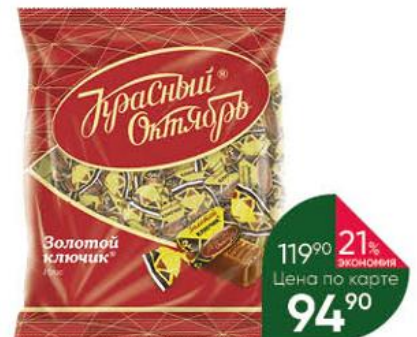
Ирис КРАСНЫЙ ОКТЯБРЬ Золотой ключик, 250 г