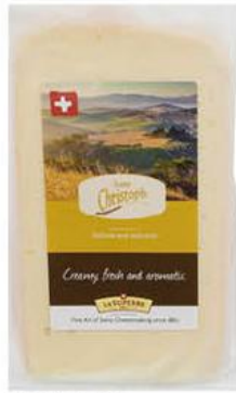
Сыр LE SUPERBE Saint Christoph 57%, 200 г

179 90 28% ЭКОНОМИЯ Цена по карте 129 90