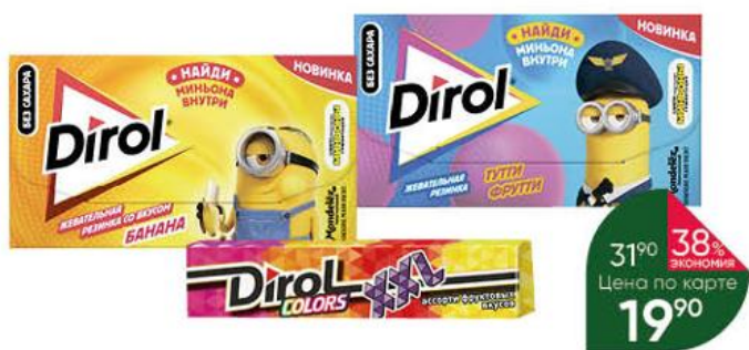
Жевательная резинка DIROL Colors XXL ассорти фруктовых вкусов; Миньоны Тутти Фрутти; со вкусом банана, 13,5-19 г