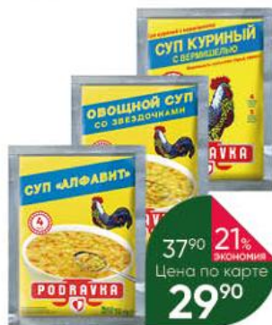
Суп PODRAVKA Алфавит; Куриный с вермишелью; Овощной со звёздочками, 52-62 г