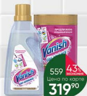
Отбеливатель; Пятновыводитель для тканей VANISH Оxi Advance в ассортименте гель, 750 мл; порошок, 400 г