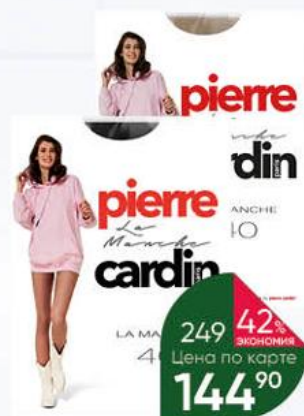
Колготки PIERRE CARDIN 40 den nero; vison, р. 2-5