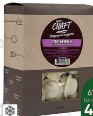
Пельмени HANDY CRAFT Табёжные с говядиной и свининой, 800 г