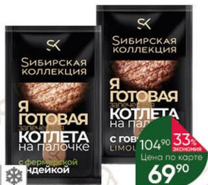
Котлета СИБИРСКАЯ КОЛЛЕКЦИЯ на палочке с говядиной; фермерской индейкой, 90 г