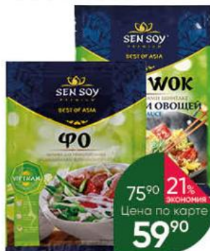
Основа для супа; Соус SEN SOY Premium Фо; Wok Терияки с грибами шиитаке, 80 г