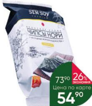
Чипсы нори SEN SOY Original из сушеных морских водорослей, 4,5 г

149 90 27% ЭКОНОМИЯ Цена по карте 109 90