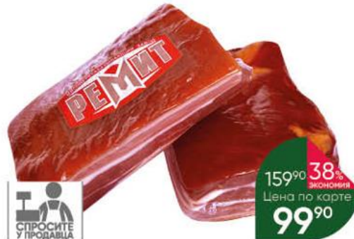
Грудинка РЕМИТ свина сырокопчёная, 100 г