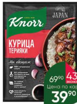
Приправа KNORR Япон курица терияки, 28 г