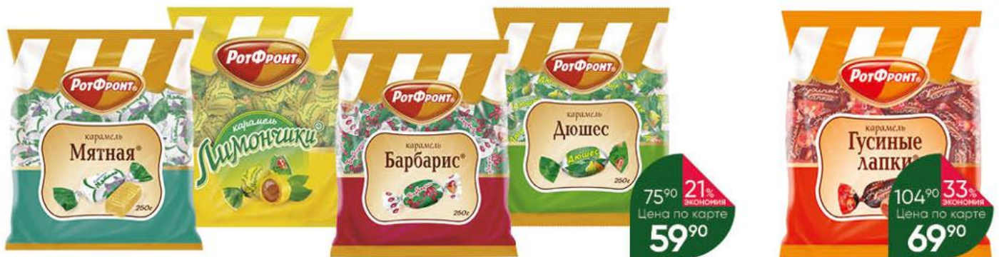
Карамель РОТ ФРОНТ в ассортименте, 250 г