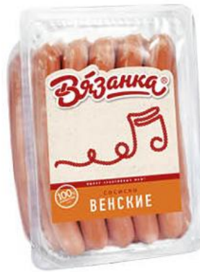
Сосиски ВЯЗАНКА Венские, 500 г