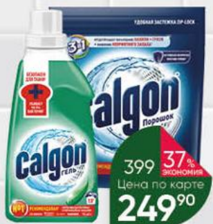
Средство CALGON для смягчения воды в стиральных машинах, 650 мл; для смягчения воды и предотвращения образования известкового налёта 3 в 1 гель, 750 мл; порошок, 750 г