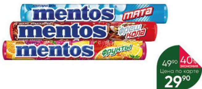
Драже MENTOS жевательные со вкусом мяты; фруктов; фреш колы, 37 г