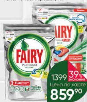
Средство для мытья посуды в посудомоечной машине FAIRY Platinum Plus; Platinum All in 1 лимон без ароматизатора капсулы, 40-50 шт.