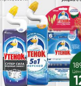
Средство для чистки унитаза ТУАЛЕТНЫЙ УТЕНОК Диски чистоты фруктовый бум; морская свежесть, 38 г, 6 шт.; Супер Сила Видимый Эффект; 5 в 1 Морской, 900 мл

189 90 32% ЭКОНОМИЯ Цена по карте 129 90