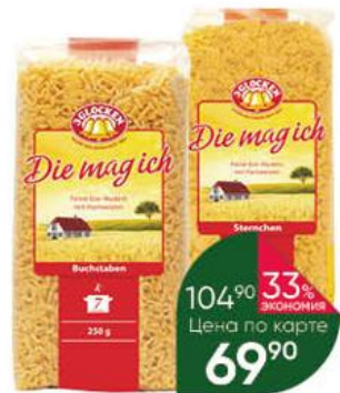
Макаронные изделия 3 GLOCKEN Die mag ich алфавит; звёздочки, 250 г