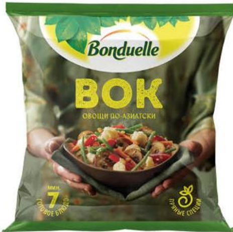
Смесь овощная BONDUELLE Овощи по-азиатски Вок, 400 г