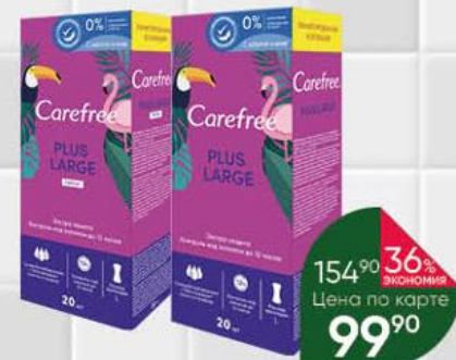
Гигиенические прокладки CAREFREE Plus Large; Plus Large Fresh, 20 шт.