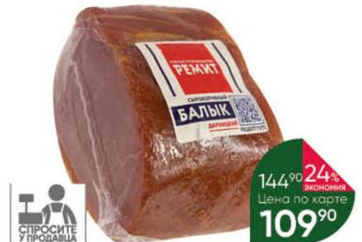
Балык РЕМИТ Дарницкий сырокопчёный, 100 г

144 90 24% экономия Цена по карте 109 90