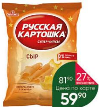
Чипсы РУССКАРТ Русская картошка сыр, 150 г