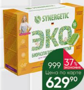
Таблетки для мытья посуды в посудомоечной машине SYNERGETIC Эко бесфосфатные, 55 шт.