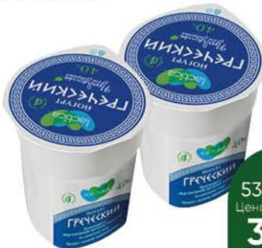
Йогурт LACTICA Греческий натуральный 4%, 120 г