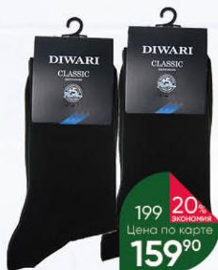
Носки DIWARI Classic в ассортименте, р. 25-29

169 90 24% ЭКОНОМИЯ Цена по карте 129 90