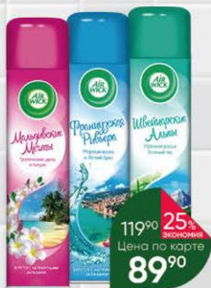
Освежитель воздуха AIR WICK в ассортименте, 290 мл