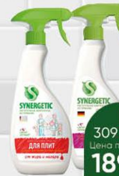
Средство биоразлагаемое SYNERGETIC для мытья сантехники; чистящее для кухонных плит, 500 мл