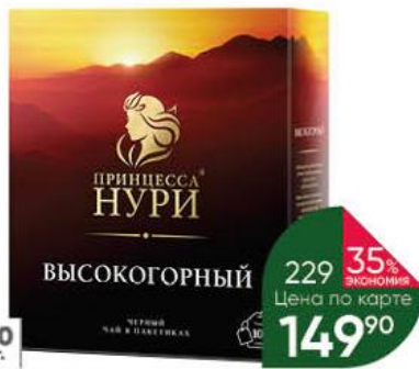
Чай ПРИНЦЕССА НУРИ Высокогорный чёрный, 100 x 2 г