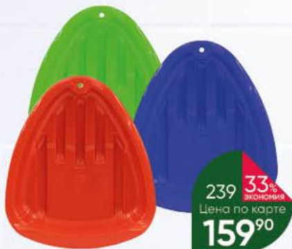
Ледянка ZEBRATOYS Снежное крыло, 15-10731, 1 шт.

299 90 27% ЭКОНОМИЯ Цена по карте 219 90