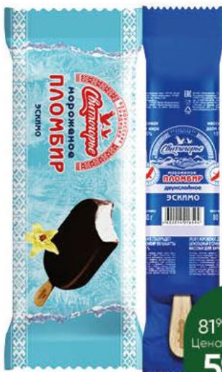
Мороженое СВИТЛОГОРЬЕ Пломбир двухслойный ванильно-шоколадный эскимо в сливочной; ванильной глазури 15%, 80 г