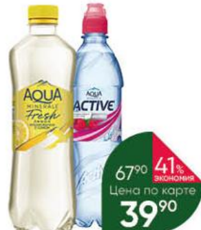
Напиток AQUA MINERALE в ассортименте негазированный, 0,5 л