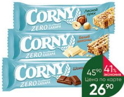
Батончик злаковый CORNY Zero без добавления сахара белый шоколад; лесной орех; шоколад, 20 г