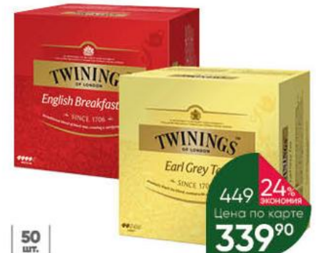
Чай TWININGS English Breakfast; Earl Grey чёрный, 50 x 2 г