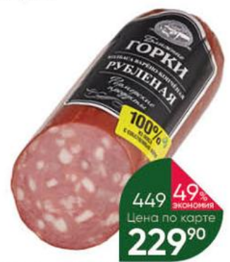
Колбаса БЛИЖНИЕ ГОРКИ Рубленая варёно-копчёная, 490 г