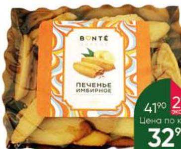
Печенье BONTÉ Вакегу имбирное сладкое, 120 г

279 90 39% ЭКОНОМИЯ Цена по карте 169 90