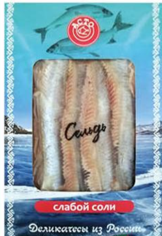
Сельдь АСТО Тихоокеанская слабосоленая филе обешкуренное, 200 г