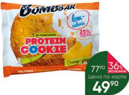
Печенье BOMBBAR Protein Cookie неглазированное апельсин-имбирь, 40 г