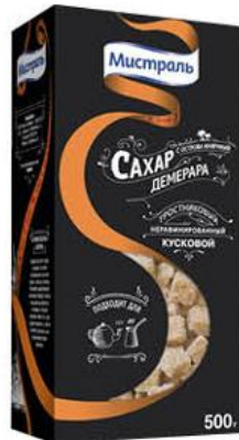
Сахар МИСТРАЛЬ Демерара тростниковый, 500 г