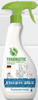
Средство биоразлагаемое SYNERGETIC для мытья окон и зеркал, 500 мл