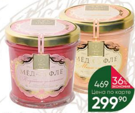
Мёд-суфле PERONI клубника-земляника; манго-маракуйя, 250 г