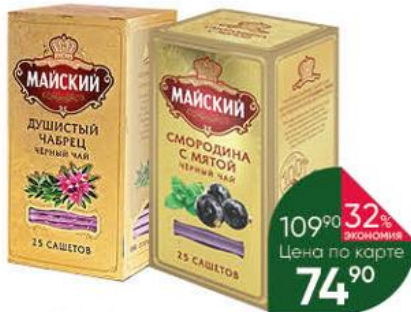
Чай МАЙСКИЙ душистый чабрец; смородина с мятой чёрный, 25 x 2 г