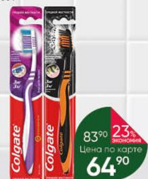
Зубная щётка COLGATE Zig Zag Древесный уголь; средней жесткости, 1 шт.