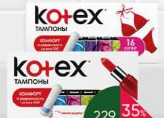
Гигиенические тампоны KOTEX Normal; Супер, 16 шт.