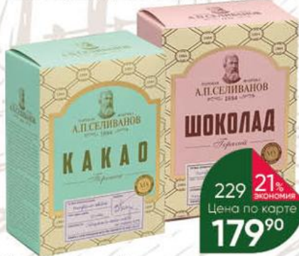
Горячий шоколад А.П.СЕЛИВАНОВ насыщенный шоколадный вкус; Классический 20% какао, 100-150 г