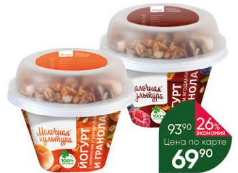
Йогурт МОЛОЧНАЯ КУЛЬТУРА абрикос-миндаль-гранола; лесные ягоды-гранола 2,7-3,5%, 215 г