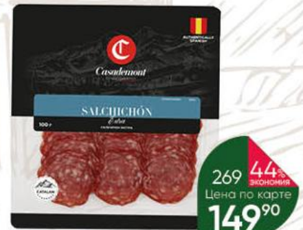
Колбаса CASADEMONT Salchichon Extra сыровяленая, 100 г

159 90 21% ЭКОНОМИЯ Цена по карте 126 90