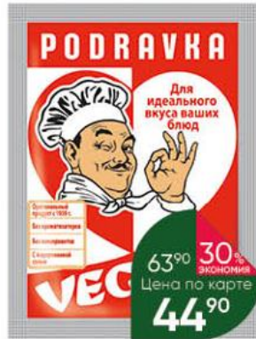
Приправа PODRAVKA Vegeta, 75 г