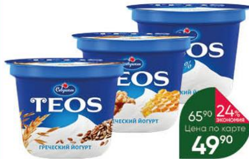
Йогурт САВУШКИН Teos Греческий злаки с клетчаткой льна; грецкий орех-мёд; натуральный 2%, 250 г