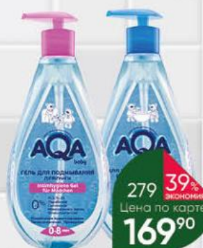
Средство AQA BABY для подмыкания девочек; для купания малыша и шампунь 2 в 1, 400–500 мл