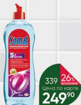
Ополаскиватель для посудомоечных машин SOMAT, 750 г