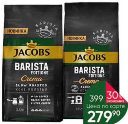
Кофе JACOBS Barista Editions Crema в зёрнах; молотый натуральный жареный, 230 г