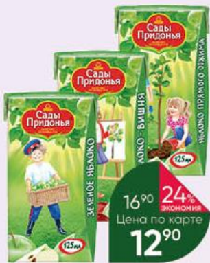
Сок САДЫ ПРИДОНЬЯ в ассортименте, 125 мл