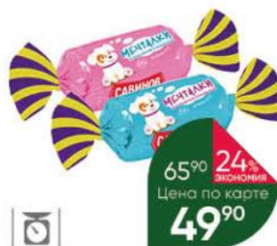
Конфеты САВИНОВ Мечталки со взрывной карамелью, 100 г