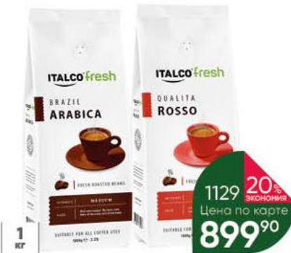
Кофе ITALCO Fresh Brazil Arabica; Qualita Rosso жареный в зёрнах с кофеином, 1 кг