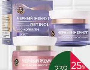
Крем для лица ЧЁРНЫЙ ЖЕМЧУГ в ассортименте, 46-50 мл