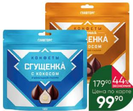
Конфеты ГЛАВОРГ варёная сгущенка с кокосом в шоколадной глазури; сгущенка с кокосом в шоколадной глазури, 140 г