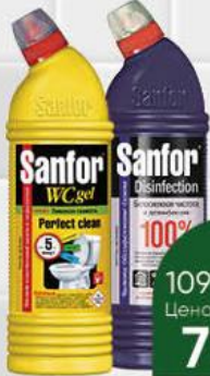
Средство чистящее SANFOR универсальное; для унитаза лимонная свежесть, 750 г