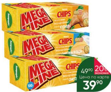
Чипсы БЕЛПРОДУКТ Mega Line картофельные в ассортименте, 100 г