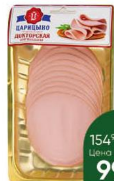
Колбаса ЦАРИЦЫНО Докторская оригинальная вареная с мясом птиц, 200 г