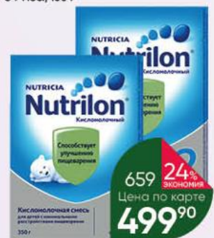
Смесь кисломолочная NUTRICIA Nutrilon сухая № 1 для детей раннего возраста; № 2 для детей с 6 мес., 350 г