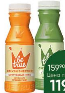
Смузи BE TRUE в ассортименте, 250 г