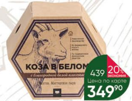
Сыр ИПАТОВ. МАСТЕРСКАЯ СЫРА Коза в белом с благородной белой плесенью 50%, 110 г