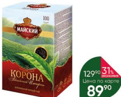
Чай МАЙСКИЙ Корона Российской Империи чёрный цейлонский крупнолистовой, 100 г