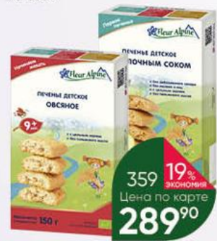
Печенье FLEUR ALPINE Первое с яблочным соком с 6 мес.; овсяное цельное зерновое детское с 9 мес., 150 г