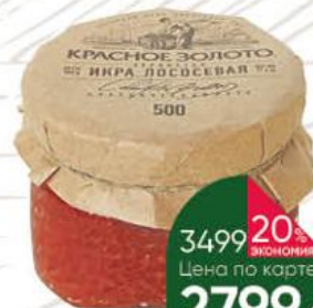
Икра лососёвая СВК Красное золото зернистая, 500 г