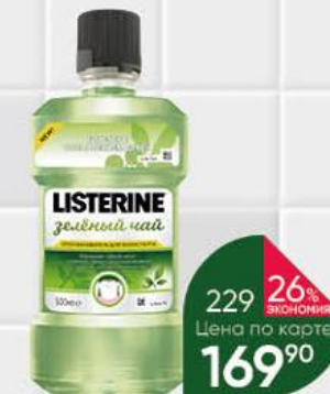
Ополаскиватель для рта LISTERINE зелёный чай, 500 мл