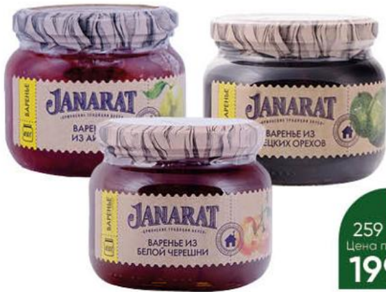
Варенье JANARAT из белой черешни; грецких орехов; айвы, 450 г

259 90 23% ЭКОНОМИЯ Цена по карте 199 90