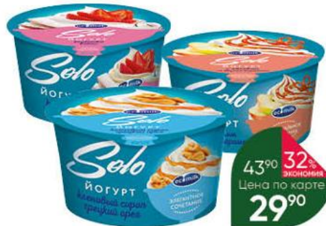
Йогурт ECOMILK Solo с кленовым сиропом и грецким орехом; клубничкой и кокосом; яблоком и со вкусом карамели 4,2%, 130 г