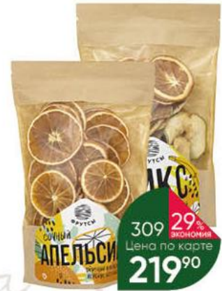
Фруктовые чипсы ФРУТСЫ Микс; Сочный апельсин, 100 г