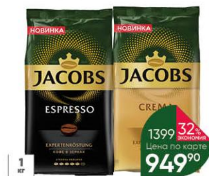
Кофе JACOBS Crema; Espresso натуральный жареный в зёрнах, 1 кг