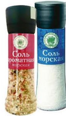
Соль ВОЛШЕБНОЕ ДЕРЕВО Ароматная морская; Морская, 300-380 г