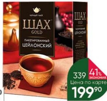
Чай ШАХ Gold цейлонский чёрный, 100 x 2 г