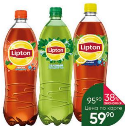
Напиток LIPTON Холодный чай зелёный; лимон; персик, 1 л