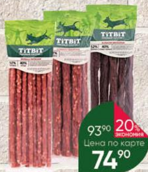
Лакомство для собак TITBIT Золотая коллекция Миланские; Пармские; Пикантные колбаски, 75-80 г

18% ЭКОНОМИЯ 21% ЭКОНОМИЯ Цена по карте 14 90