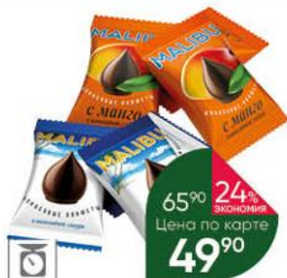
Конфеты МАЛИБУ кокосовые; кокосовые с манго в шоколадной глазури, 100 г