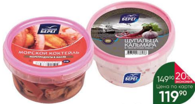
Морской коктейль; Щупальца кальмара БАЛТИЙСКИЙ БЕРЕГ из морепродуктов в масле; в чесночном соусе, 210 г

149 90 20% ЭКОНОМИЯ Цена по карте 119 90