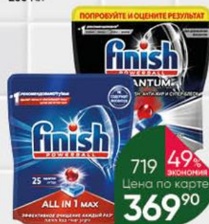
Средство для мытья посуды в посудомоечной машине FINISH Powerball All in 1 Max таблетки, 25 шт.; Ultimate капсулы, 15 шт.