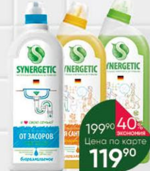
Средство биоразлагаемое SYNERGETIC для мытья сантехники; для чистки труб в ассортименте, 0,7-1 л

199 90 40% ЭКОНОМИЯ Цена по карте 119 90