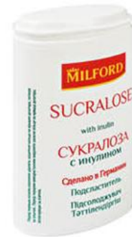
Заменитель сахара MILFORD сукралоза с инулином, 370 таблеток