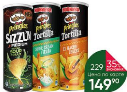
Чипсы PRINGLES Tortilla; Sizzlin; Asian Collection в ассортименте, 160 г