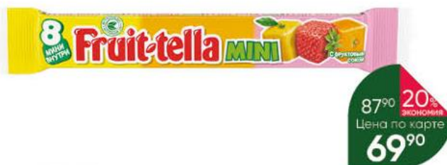
Конфеты FRUIT-TELLA Mini с фруктовым соком, 88 г