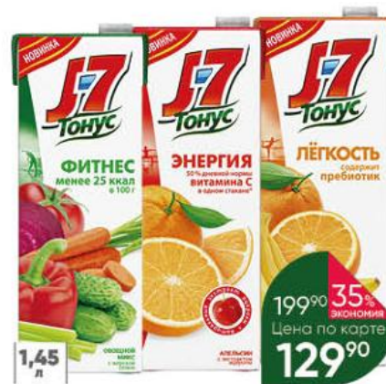
Нектар J7 Тонус в ассортименте, 1,45 л

199 90 35% ЭКОНОМИЯ Цена по карте 129 90