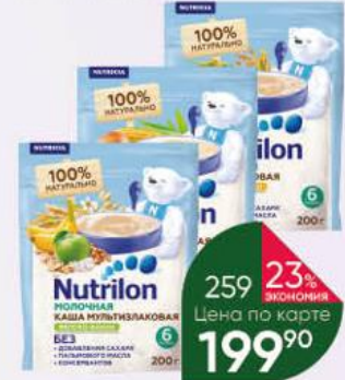
Каша NUTRICIA Nutrilon молочная кукурузная с абрикосом и бананом; мультизлаковая с яблоком и бананом; рисовая с яблоком и бананом с 6 мес., 200 г