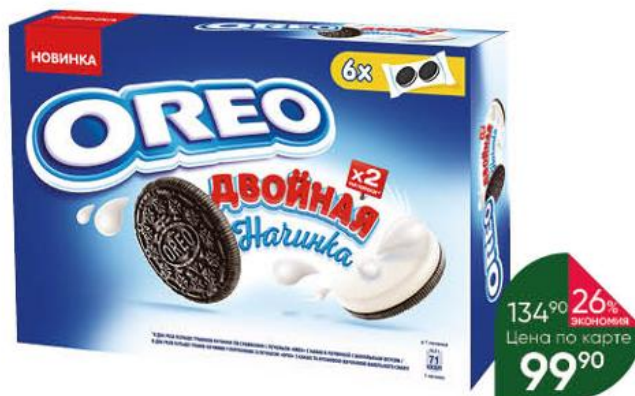
Печенье OREO Двойная начинка с ванильным вкусом, 170 г