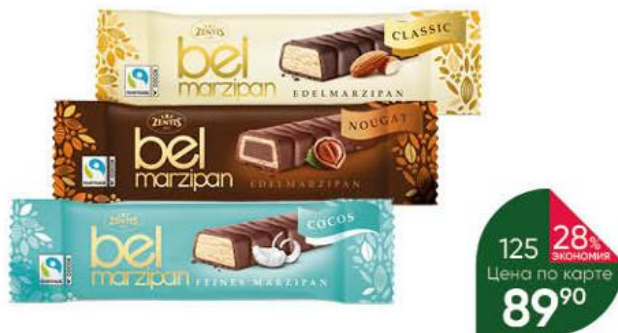
Марципановый батончик ZENTIS Bel Marzipan классический; с кокосом; с фундушной нугой покрытый шоколадом, 40 г