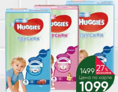
Трусики-подгузники HUGGIES Boy; Girl в ассортименте, 44-52 шт.