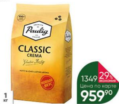
Кофе PAULIG Classic Crema натуральный жареный в зёрнах, 1 кг