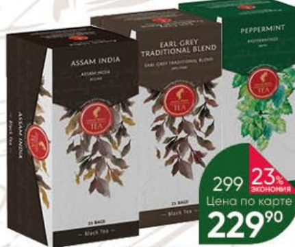
Чайный напиток JULIUS MEINL в ассортименте травяной, 25 x 1,4-2 г