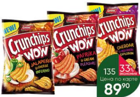
Чипсы LORENZ Crunchips Wow со вкусом сыра чеддер и красного лука; перца халапеньо и сливочного сыра; сливочной паприки, 110 г