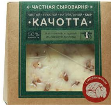
Сыр ЧАСТНАЯ СЫРОВАРНЯ Качотта с грецким орехом 50%, 260 г

139 90 24% ЭКОНОМИЯ Цена по карте 106 90