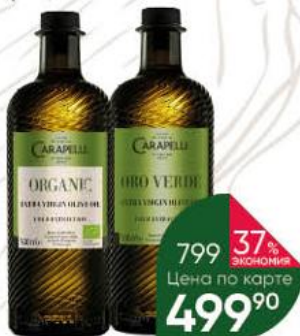
Масло оливковое CARARELLI Extra Virgin Oro Verde; Organic, 500 мл