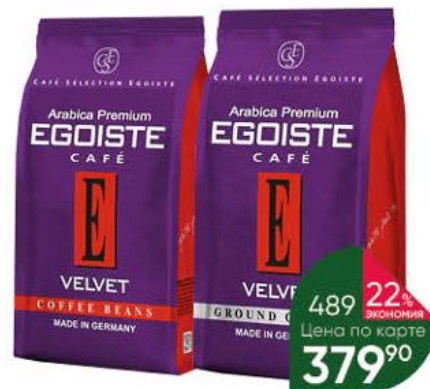
Кофе EGOISTE Velvet в зёрнах; молотый, 200 г