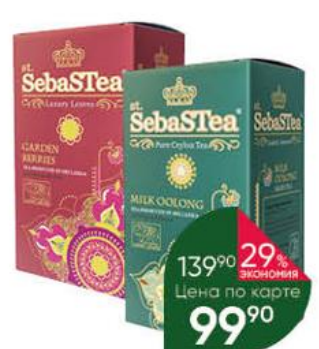
Чай ST.SEBASTEIA в ассортименте, 25 x 1,5-2 г