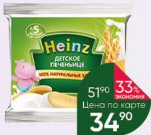
Печенье HEINZ детское со злаками, 60 г