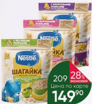
Каша NESTLE Шагайка 5 злаков; с хлопьями сухая молочная в ассортименте с 12 мес., 190-200 г