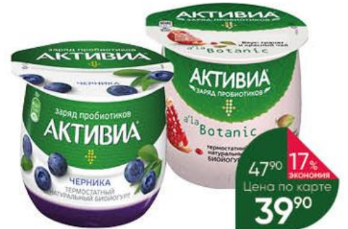
Биойогурт DANONE Активиа Заряд пробиотиков термостатный в ассортименте 2,7-3,5%, 170 г