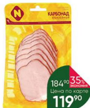
Кarbonad ОСТАНКИНО Юбилейный, 150 г

184 90 35% экономия Цена по карте 119 90