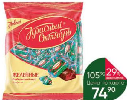
Конфеты КРАСНЫЙ ОКТЯБРЬ желейные барбарисовый вкус, 250 г