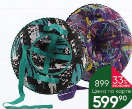
Санки Ватрушка надувная 65 см, 1 шт.