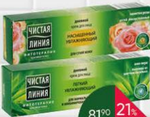
Крем для лица ЧИСТАЯ ЛИНИЯ Фитотерапия лепестки розы; алоэ- вера увлажняющий дневной, 40 мл