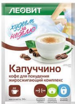
Кофе ЛЕОВИТ Худеем за неделю капучино для похудения жиросжигающий комплекс, 14 г