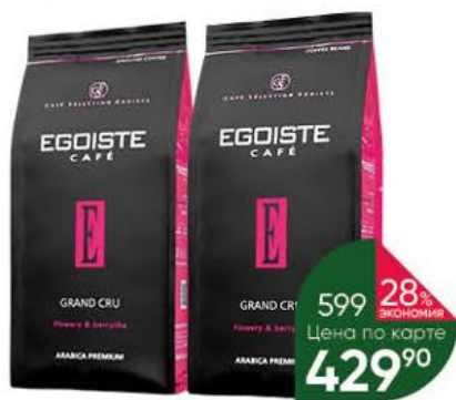
Кофе EGOISTE Grand Cru натуральный жареный в зёрнах; молотый, 250 г