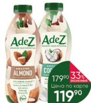
Напиток ADEZ Воспитительный миндаль; Освежающий кокос, 800 мл

179 90 33% ЭКОНОМИЯ Цена по карте 119 90