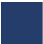
Pantone 18-4434 Mykonos Blue