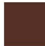
Pantone 19-1228 Root Beer