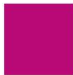
Pantone 18-2330 Fuchsia Fedora