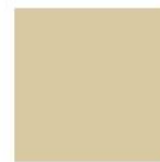
Pantone 13-0919 Soybean