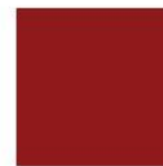
Pantone 18-1453 Fire Whirl