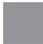
Pantone 17-5104 Ultimate Gray