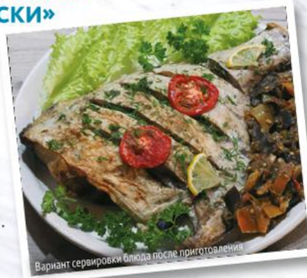
Вариант сервировки блюда после приготовления

Промыть палтус прохладной водой и обсушить, вытерев бумажным полотенцем.